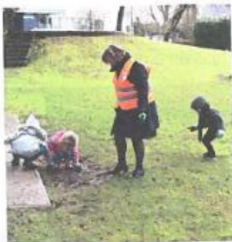
Les écoliers de Notre-Dame ont eu fort à faire.