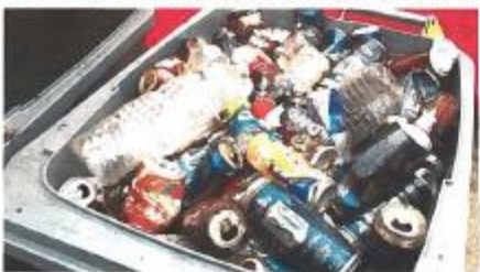
Une poubelle pleine de canettes et bouteilles en plastique.