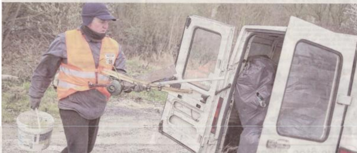
Le nombre d'objets « oubliés » dans la nature est très impressionnant. À Saint-Quentin par exemple, les bénévoles ont retrouvé des sachets de drogue. par Fabrice

L'opération Hauts de France propre ce week-end a permis à des bénévoles de nettoyer une partie de la nature. Des tonnes de déchets sauvages ont été récoltées. Mais quelles sont les ordures les plus répandues ? Nous avons établi un triste palmarès.