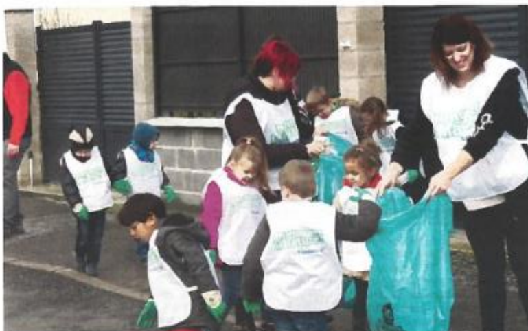
Les enfants de l'école maternelle "La souris verte" ont participé au ramassage des déchets.

Le lendemain, les bénévoles de l'association Caja, en partenariat avec les Randonneurs de l'Ailette, le CPIE de Merlieux et la Région Hauts de France ont organisé l'opération "Hauts-de-France Propres, ensemble nettoyons notre région !". Avec la participation d'un âne, et durant une balade d'1h30, 200 kg de déchets ont été récoltés.