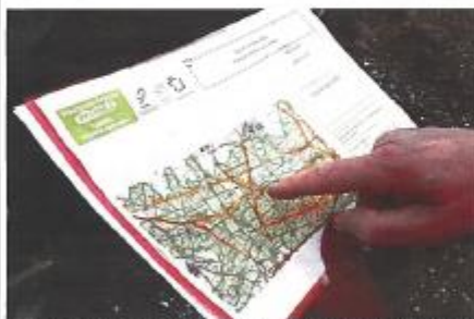
Sous l'égide des Hauts-de-France, une carte délimite spécifiquement la zone qui doit être nettoyée par «l'équipage cerf» de Villers-Cotterêts.