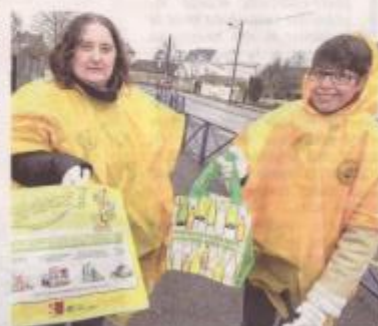
Du côté quartier Saint-Waast, à l'école Galilée, beaucoup de déchets devant cette école de Soissons ont été ramassés.