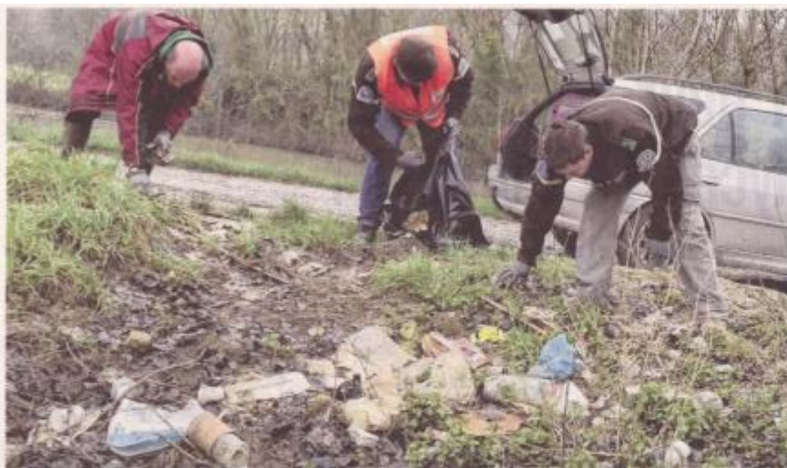
À Pacy, un grand quartier de gros déchets jetés sur les bords de l'Yonne.