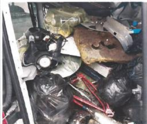
Enjoliveurs, bouteilles en verre, pièces automobiles, des déchets de toute nature ont été collectés.