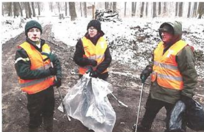
Nettoyeurs en action avec un agent de l'ONF.