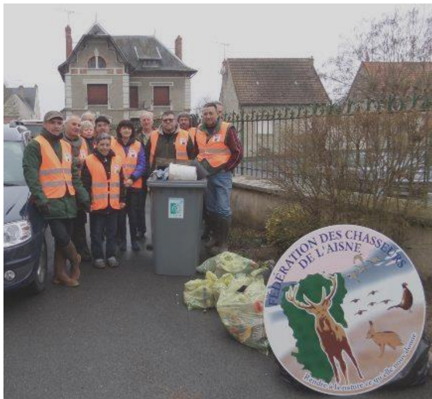
Les habitants, les pêcheurs et les chasseurs de la commune de BOURG ET COMIN Responsable : Valérie Mabilat