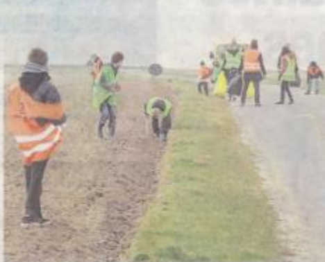
La plupart des rendez-vous auront lieu samedi. (photos)

Dans le canton de Moy-de-l'Aisne, quatre communes participeront à cette campagne. À Essigny-le-Grand, les quatre classes de maternelle au CM2 seront chargées de nettoyer la ville vendredi. À Brissy-Hamégicourt, le