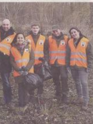
Les jeunes ont pris une part active au nettoyage en 2017.

Il ne faut pas oublier que le succès de cette première édition à grande échelle ne