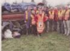
Le maire et les chasseurs devant leurs prises de guerre.

Une quinzaine de chasseurs avaient entrepris le ramassage, et hélas, ce ne sont pas des champi-