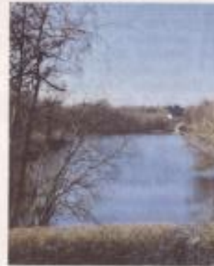
L'étang de Fontaine-lès-Vervins fera aussi l'objet d'un nettoyage de printemps.

Plusieurs écoles du secteur ont également préparé une action avec les élèves et partiront à la