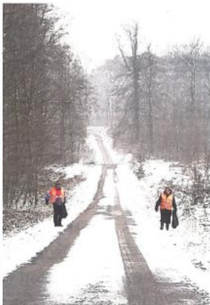
Chaudement équipés, les nettoyeurs n'ont pas chômé.