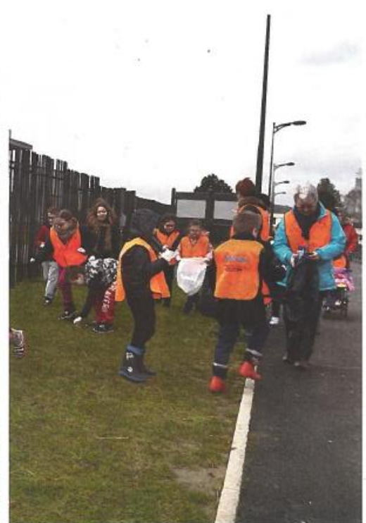
Plus de déchets aux abords de l'école Jules Ferry.

sauver la planète mais personne ne veut descendre les poubelles» ironisait Jean Yanne. A notre humble niveau, sauvons notre commune et descendons nettoyer les espaces naturels avant qu'ils ne ressemblent à des poubelles !