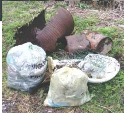
L'Amicale des Pêcheurs de TERGNIER Responsable : René Givliani