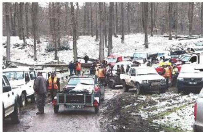
Les 4x4, tant décriés par les opposants à la chasse à courre, sont ici bien pratiques.