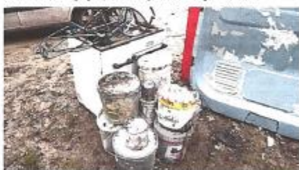
Nettoyer la forêt, ce n'est pas bidon.