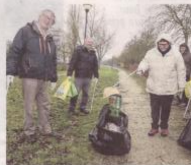
Sur l'ancienne voie de chemin de fer, dans le quartier de Prestes à Soissons.