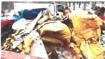
C'était peut-être de la laine de verre pour réchauffer la nature ?