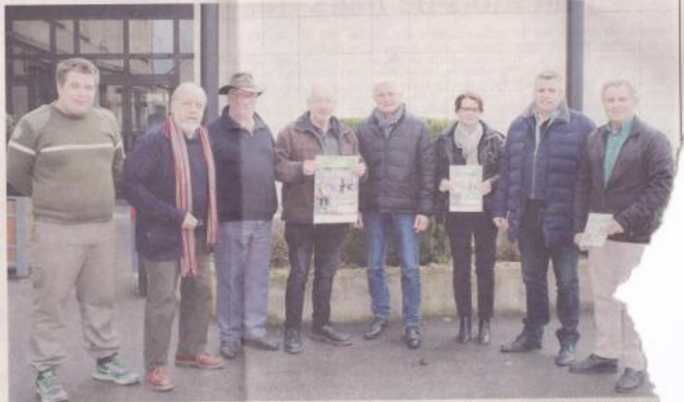
Chasseurs, pêcheurs, élus de Bucy-le-Long, de Saint-Mard ou de Braine, demandent aux autres communes de participer à l'opération Hauts de France propres.