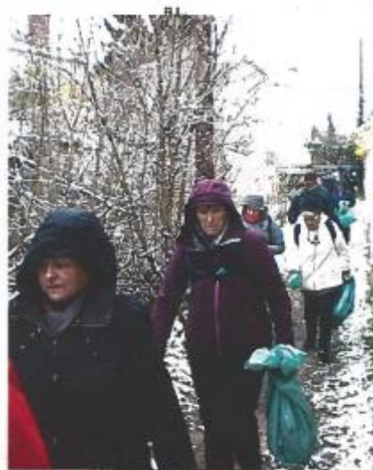
Il ne faisait pas chaud dimanche matin.