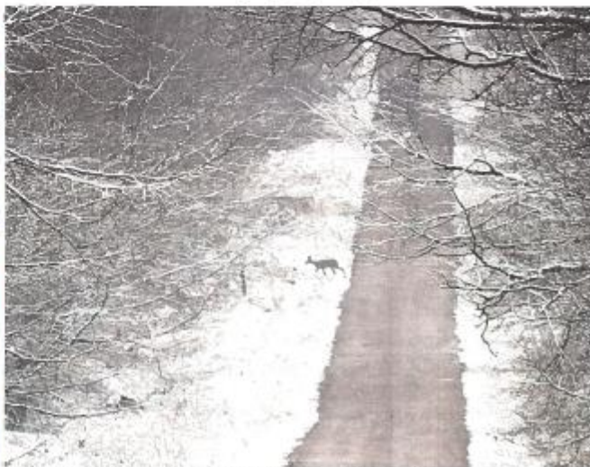
La chevreuil, au petit matin, se détache clairement sur fond de neige.