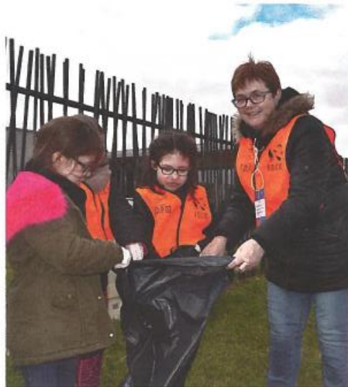
Les enfants ont appris l'intérêt du tri.

Cette deuxième opération aura permis de récolter papiers, canettes, bouteilles plastiques et surtout une trentaine de sacs remplis. Et après l'effort, madeleine, compote et boisson ont