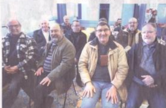
L'assemblée générale, un moment important pour les pêcheurs.

Les cartes de pêche ne sont accessibles que par internet ou chez un dépositaire internet. Pour Guise, il s'agit du Magasin Cycle et Pêche de la rue Camille Desmoulins qui va être transféré dans