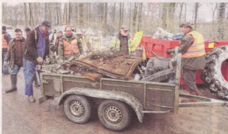
Dimanche matin en forêt de Retz, c'est plus de 65m 3 de déchets qui ont été collectés pour la deuxième édition "Hauts-de-France propre", impulsée par la Région Hauts-de-France et les fédérations de chasse et de pêche, en partenariat pour la forêt de Retz avec l'ONF, la communauté de communes ainsi que de nombreuses associations locales.