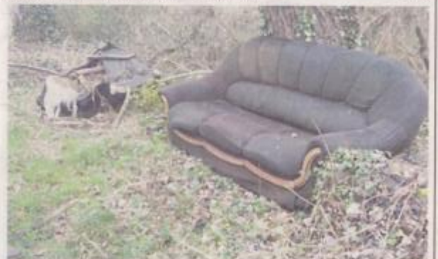
Petit florilège d'objets ramassés en forêt, dans les chemins ou le long des berges, à Braine, par les pêcheurs et chasseurs.