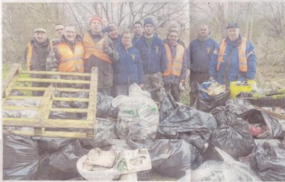
L'impressionnante collecte de l'année dernière sur un seul des 2500 points de ramassage. Et il est probable que l'apogée 2018 rassemble à s'y méprendre, à côté de l'année dernière.

HAUTS-DE-FRANCE La Région renouvelle le week-end prochain son opération qui a vu l'année dernière des dizaines de milliers de bénévoles se mobiliser pour nettoyer la nature.