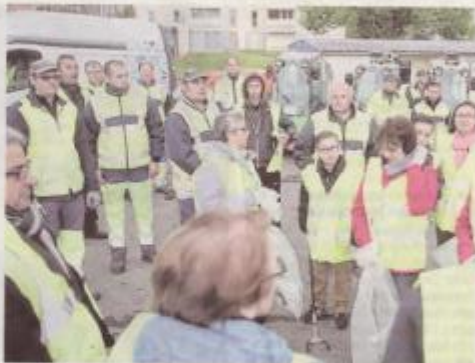
L'an dernier, l'opération avait réuni environ 500 Saint-Quentinois.

droient dans le quartier Saint-Jean de 9 à 12 heures (au centre Kergomard) et l'après-midi de 14 à 17 heures au quartier Europe (au départ du centre social). Le quartier Saint-Martin sera au centre de l'attention le jeudi 5 avril de 9 à 12 heures, le rendez-vous est fixé au 90 rue de Paris. S'en suivront respectivement, les quartiers Artois-Champagne-Vermand et le centre-ville le 31 mai de 9 à 12 heures et de 14 à 17 heures. Les quartiers Faubourg d'Isle et Neuville seront nettoyés le 7 juin. Une opération de tractage en