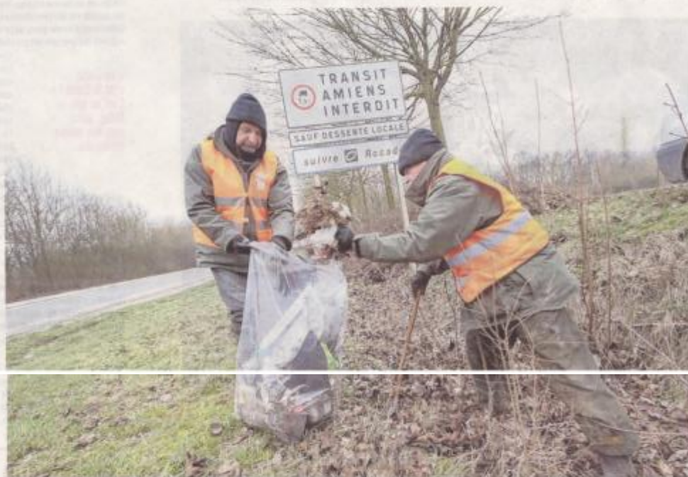
Deux membres de la société de chasse de Camon, près d'Amiens, ramassent des débris sur les bords d'une nationale.

Ce samedi matin, les très nombreux bénévoles mobilisés pour cette seconde édition de l'opération ont encore pu le constater. C'est notamment le cas à Camon, aux portes d'Amiens, où les membres de la société de chasse locale impliqués dans ce nettoyage n'en finissent plus de remplir de grands sacs-poubelles. Parmi les nombreux déchets récoltés, beaucoup de bouteilles de vin et de cannettes de bière, mais aussi des objets en tout genre, pneus, cuvettes de toilettes, ou encore bouteilles en plastique remplies d'urine, probablement abandonnées par des chauffeurs routiers,