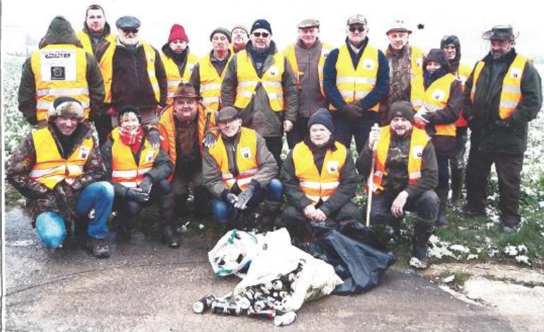
Les chasseurs ont également ramassé les cochonneries déposées par des indélébiles dans la nature.