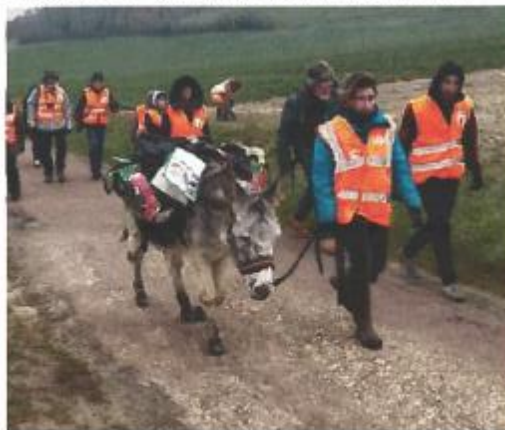
Les bénévoles de l'association Caja ont fait appel à un âne pour les aider à transporter les 200 kg de déchets ramassés.