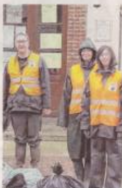
La collecte avait été fructueuse l'an dernier. (photo d'archives)