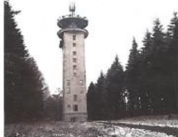
Un "nettoyage" à l'ombre de la tour des télécoms au bout du chemin des Crapaudières, à Visières.