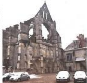
L'abbaye de Longpont, un point de départ des "nettoyeurs".