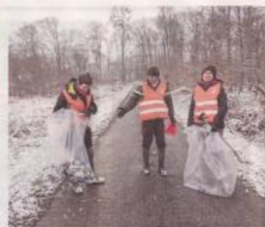
Plus de 170 personnes ont parcouru pendant 3 heures les routes et allées (route de Fiers, de Viviers, de Compiègne, allée Royain...) en forêt de Retz.